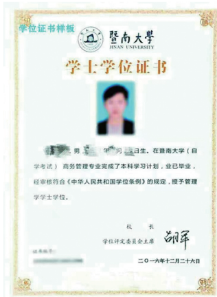
暨南大学本科学士学位证书